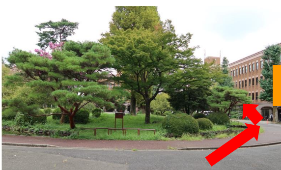
東キャンパスの正門に入り、ロータリーに沿って右に進む