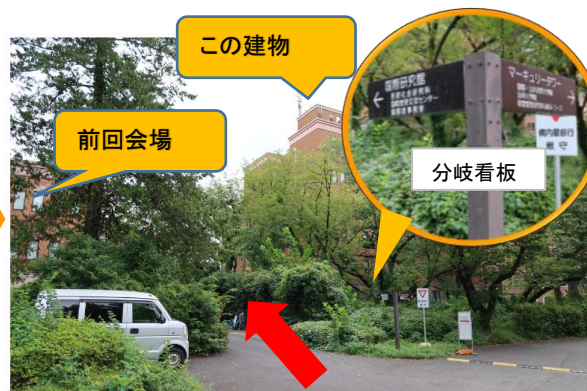
二次選考の会場の建物を左手に見ながらさらに奥に進む