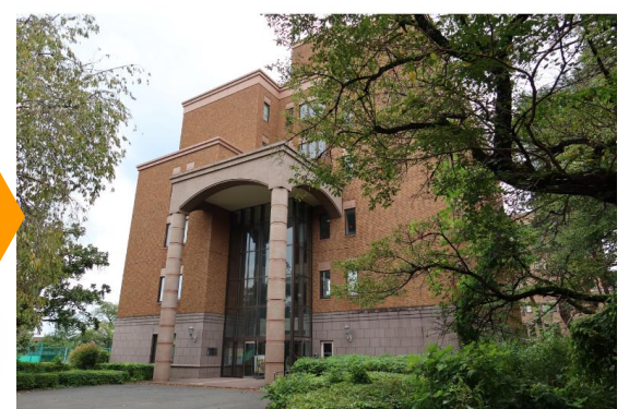
テニスコートの手前が国際研究館です